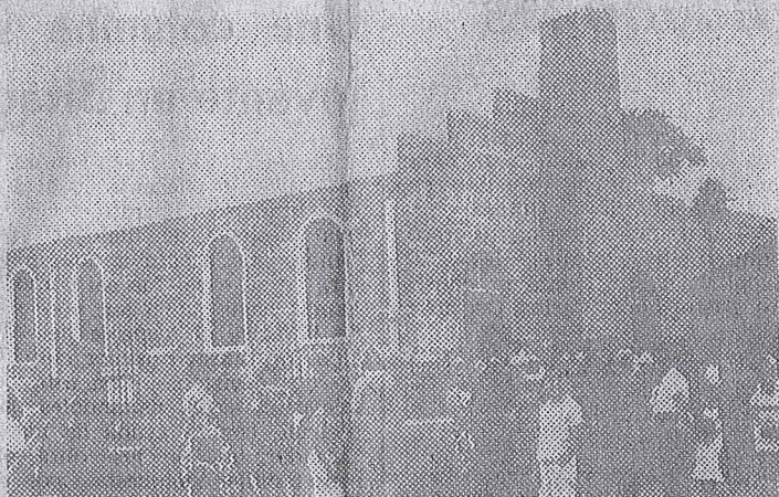
YUMBO. - El nuevo templo de los Hermanos Menonitas el día de su inauguración, que se realizó el 18 de abril.

SOBRE ACTIVIDADES EN LA CONFERENCIA DE LOS HERMANOS MENONITAS